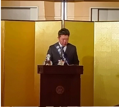
【テーマ】 ロータリーのマジックで「地球にやさしい未来

2024~2025年度 国際ロータリー 第2780地区 Rotary 第4グループ Intercity Meeting 懇親会