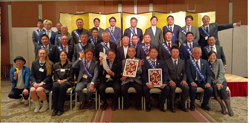
【テーマ】 ロータリーのマジックで「地球