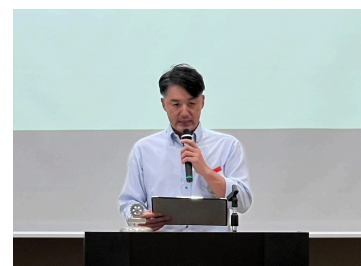
社会・国際・職業奉仕委員長