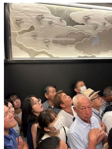
エレベーターの中