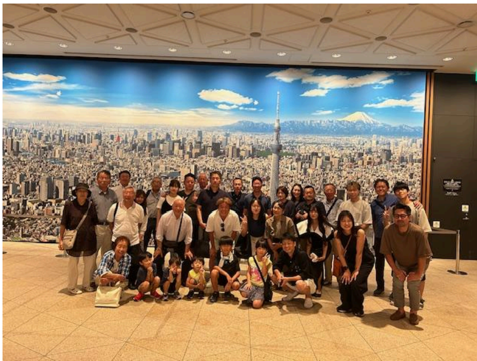
全体写真 スカイツリーにて