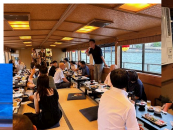
SAA古郡さん締め挨拶