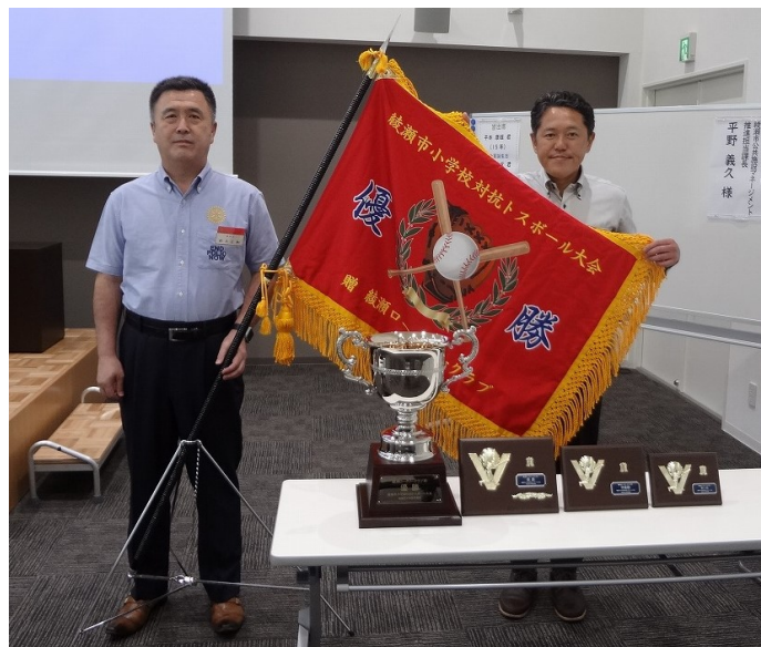
「綾瀬市小学校対抗トスボール大会」優勝旗

徐々にではありますが、ここに来て懇親会付きの会議が増えてきた感じがします。新型コロナウイルス対策を講じながらではありますが、外での飲食の回数が増えてきたように思われます。ただ、この2年の間ほとんど懇親会が無かったせいなのか飲む量がすごく少なくなったように感じています。クラブの炉辺会合が復活する日も近いかなと期待しています。